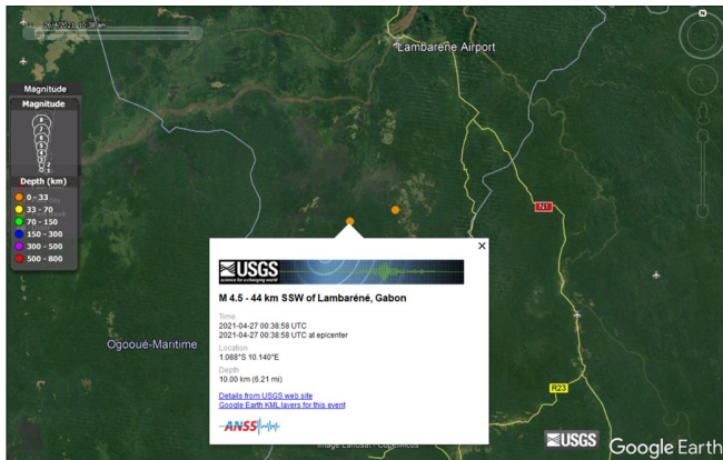
(*) Localisation de l'épicentre du premier séisme